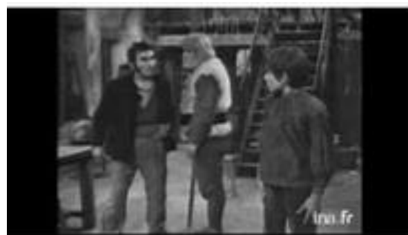
Le théâtre de la jeunesse - E55 - Sans famille (1/2... ina.fr